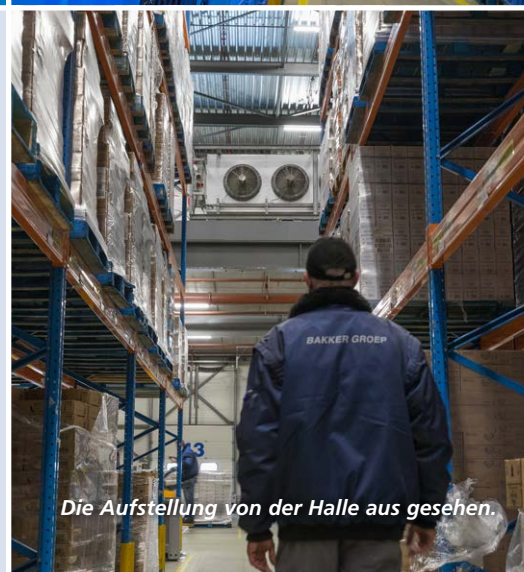
Die Aufstellung von der Halle aus gesehen.

Bei sehr grossen Räumen wie hier bei Bakker Logistics kann die Temperaturregelung eine gehörige Herausforderung darstellen, insbesondere, wenn ein Raum nicht vorrangig für die temporäre Lagerung derartiger temperaturempfindlicher Produkte ausgelegt ist. Wenn dann im Sommer auch noch die Sonne kräftig auf das Dach des Vertriebszentrums scheint, ist das Mieten von Raumkühlung eine flexible Lösung, um den Betrieb aufrechterhalten.