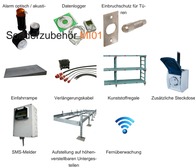
Alarm optisch / akustisch