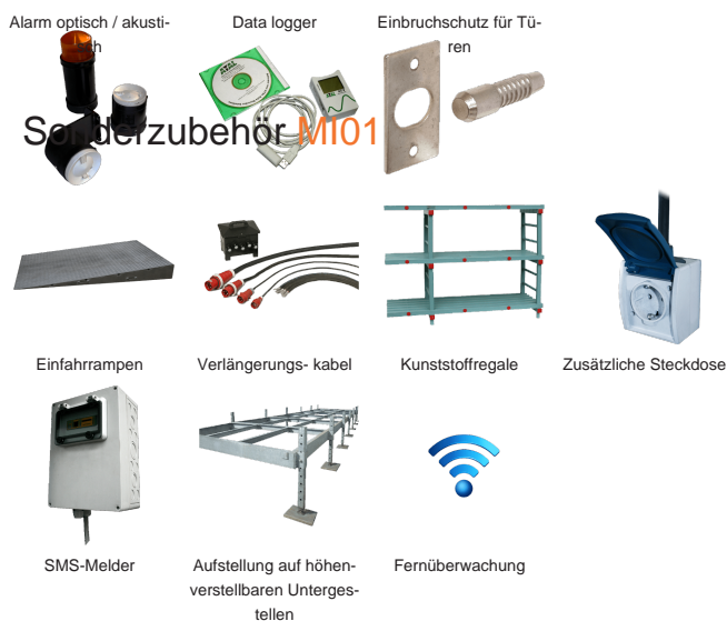
Alarm optisch / akusti-