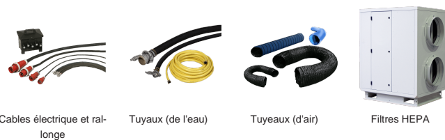
Cables électrique et rallonge