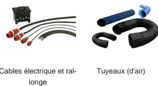
Cables électrique et rallonge